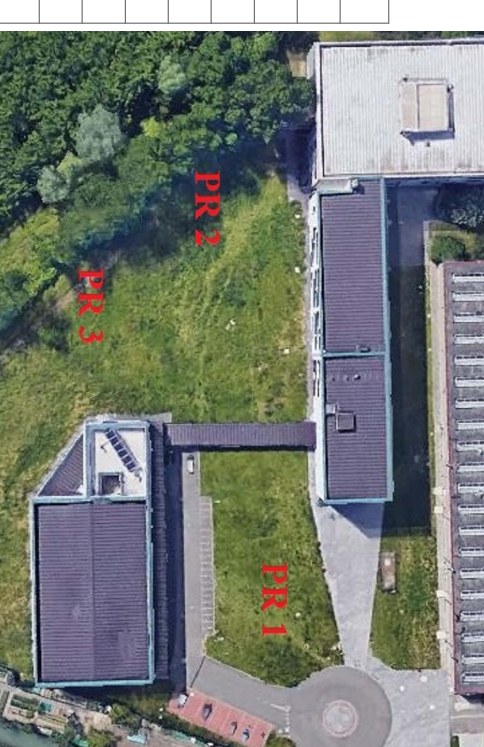
PLANIMETRIA GENERALE DISPOSIZIONE PUNTI DI RITROVO