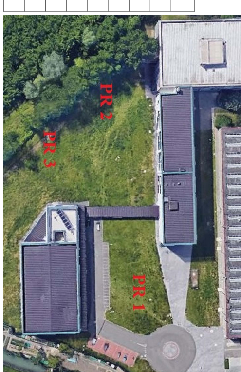
PLANIMETRIA GENERALE DISPOSIZIONE PUNTI DI RITROVO